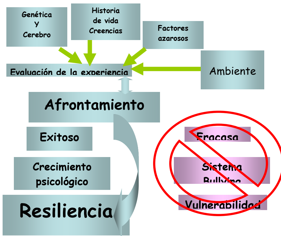
Gráfico: trayectoria de Éxito del set de afrontamiento frente al buleo. (García Coto, 2007).

Veamos entonces, desde esta perspectiva, otra trayectoria posible: