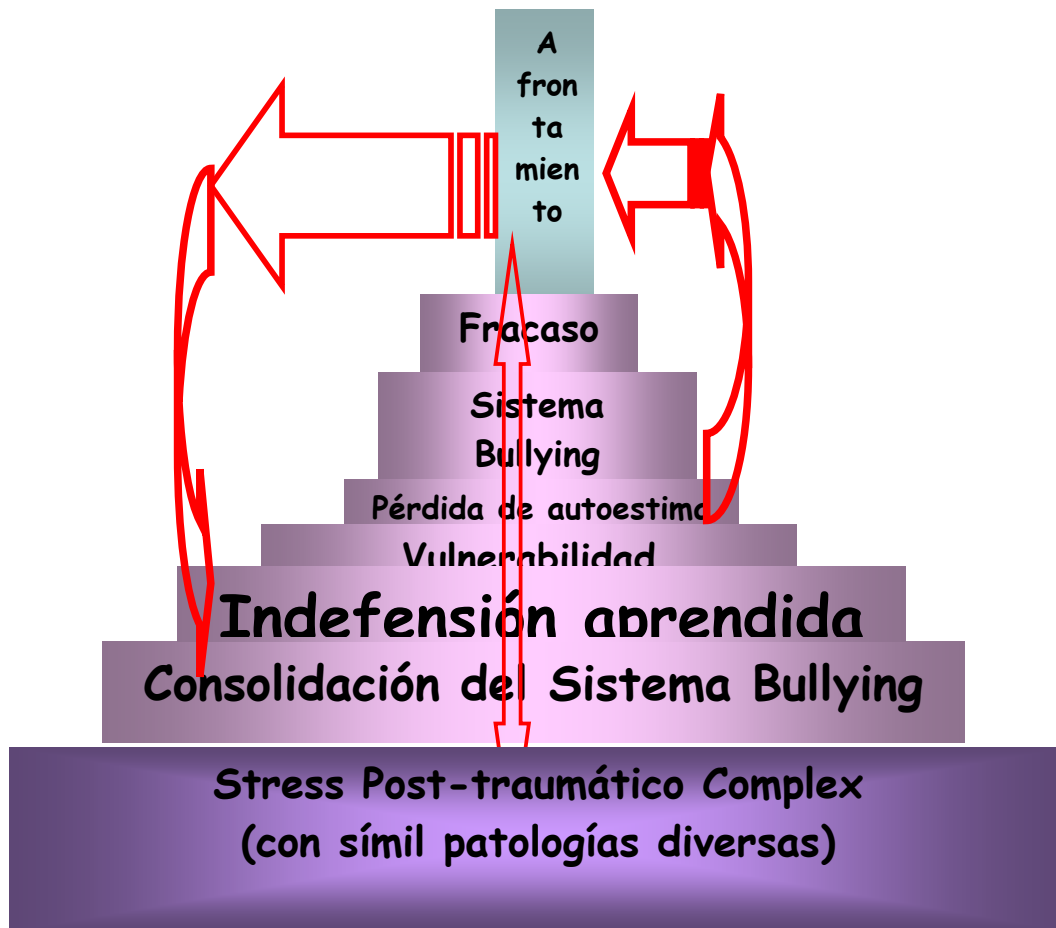
Gráfico: trayectoria de fracaso del set de afrontamiento frente al buleo. (García Coto, 2007).

El fracaso del set de afrontamiento del niño, desencadena situaciones que tienen que ver con el Sistema Bullying, esto lo lleva a perder su autoestima, sentirse más vulnerable, justificar de algún modo al buleador y disminuir aún más la sensación de autoeficacia con el consiguiente debilitamiento progresivo del set cognitivo de afrontamiento.